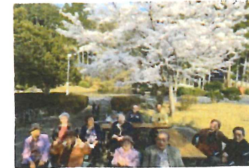
< 光寿園庭園でお花見 >