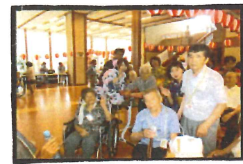
< 夏祭り >