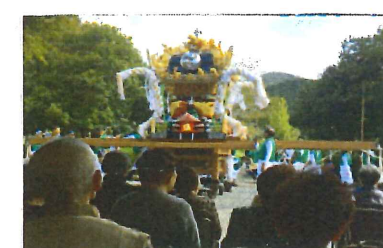
< 秋祭り・塩田・古知え庄屋台練り >