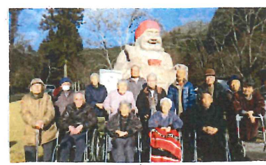
< 初詣 >