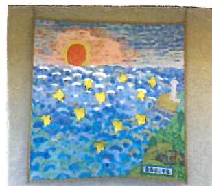
< 青海波と千鳥 >