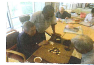
男性利用者様に人気！ 五目並べ