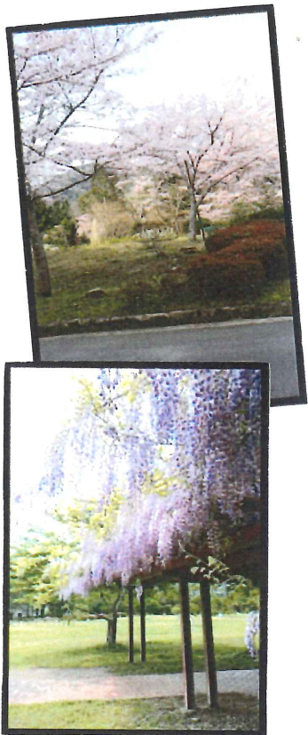
< 5月の藤棚 >

デイサービスセンター光寿園は、 ご利用者様に笑顔多く過ごして頂く事を 目指し、豊かな緑に包まれたゆったりとした 環境で楽しく健やかな生活をサポートします。 デイルームは一日中陽当たりがよく開放感 たっぷり！そして何と言ってもデイルームからの 眺めは最高です！のどかな田園風景と共に 桜、新緑、紅葉など四季折々の風景を お楽しみ頂けます。