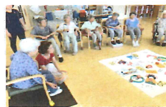
レクリエーション活動