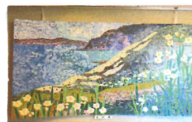
< 水仙郷 >