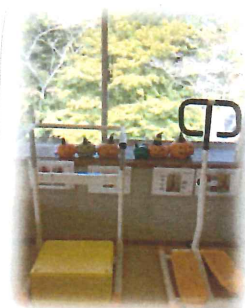
< 玄関前の紅葉 >